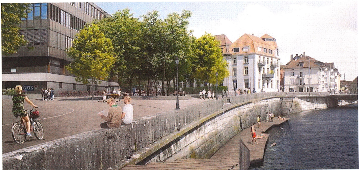
Abbildung 1: Visualisierung Aareplattform (Stand Vorprojekt), w+s Landschaftsarchitekten AG, Solothurn

Der neue Aarezugang ist wohl das wichtigste Element der Platzgestaltung. Vorgesehen ist eine Stahlkonstruktion mit einem Holzdeck und zwei Treppenanlagen aus Stahl und Holzstufen. Die Plattform schliesst an den heute bereits bestehenden Steg um das Widerlager der Eisenbahnbrücke an. In diesem Bereich ist eine einfache Liftanlage für den barrierefreien Zugang auf die Plattform geplant. Auf der Ostseite wird ein weiterer Zugang neu erstellt. Damit ist die Aareplattform von beiden Seiten durchgehend erschlossen. Die historische Mauerstruktur entlang der Aare bleibt aus Gründen des Denkmalschutzes unversehrt. Die notwendigen Verankerungen der Treppen hinter der bestehenden Ufermauer wurden zusammen mit den Arbeiten am Postplatz bereits realisiert.