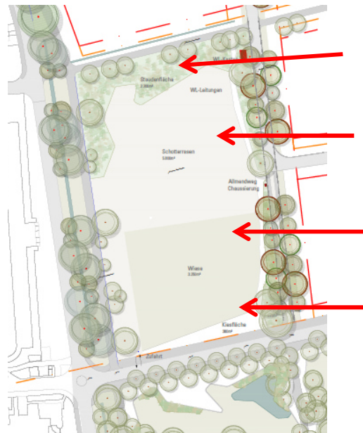
Abbildung 2: Grünraumplan Allmend