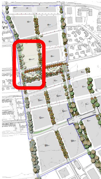
Abbildung 1: Situationsplan Weitblick